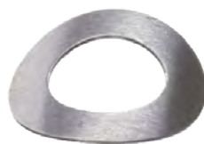
Spring Washer x24