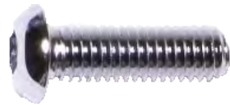
6mm Cap Screws x24