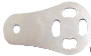
Terminal Bars x2