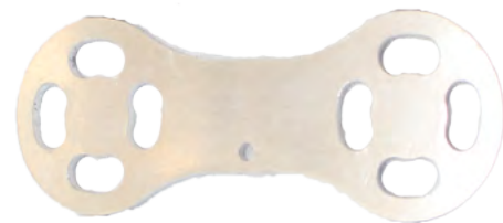
Bus Bar x6