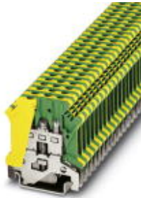
Ground modular terminal block, Connection method: Screw connection, Cross section: 0.2 mm 2 - 4 mm 2 , AWG 24 - 12, Width: 6.2 mm, Color: green-yellow, Mounting type: NS 35/7.5, NS 35/15, NS 32

Please be informed that the data shown in this PDF Document is generated from our Online Catalog. Please find the complete data in the user's documentation. Our General Terms of Use for Downloads are valid ( http://download.phoenixcontact.com )