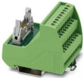
VARIOFACE sensor module, for connecting 8 pnp sensors

Please be informed that the data shown in this PDF Document is generated from our Online Catalog. Please find the complete data in the user's documentation. Our General Terms of Use for Downloads are valid ( http://phoenixcontact.com/download )