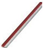
Continuous plug-in bridge, Length: 500 mm, Color: red

Continuous plug-in bridge - FBST 500-PLC RD - 2966786