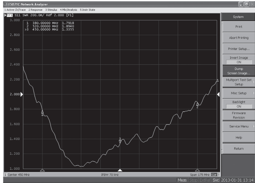
VSWR Plot (Measured on 2' x 2' GP)