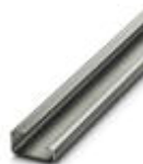
G-profile DIN rail, material: Steel, unperforated, height 15 mm, width 32 mm, length 2 m

DIN rail - NS 32 UNPERF 2000MM - 1201015