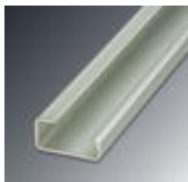
G rail 32 mm (NS 32)

DIN rail - NS 32 AL UNPERF 2000MM - 1201028