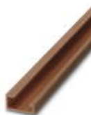
G-profile DIN rail, deep-drawn, material: Copper, unperforated, height 15 mm, width 32 mm, length 2 m

DIN rail - NS 32 CU/120QMM UNPERF 2000MM - 1201280