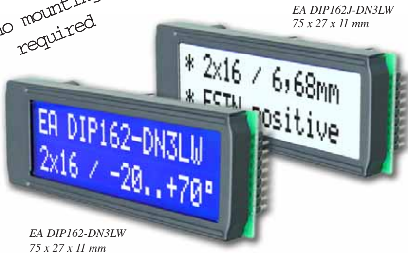
EA DIP162J-DN3LW 75 x 27 x 11 mm