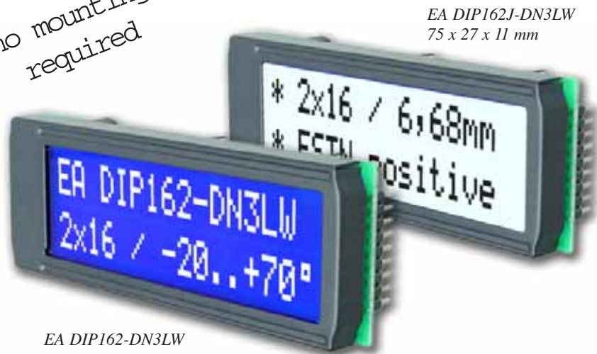
EA DIP162J-DN3LW 75 x 27 x 11 mm