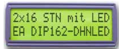
EA DIP162-DHNLED 68 x 27 x 11 mm