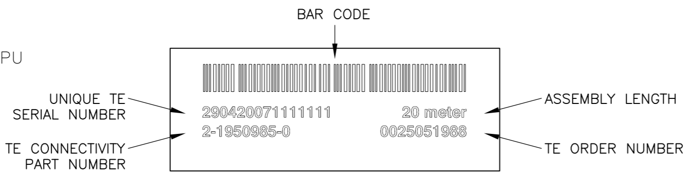
LABEL DETAIL: 3