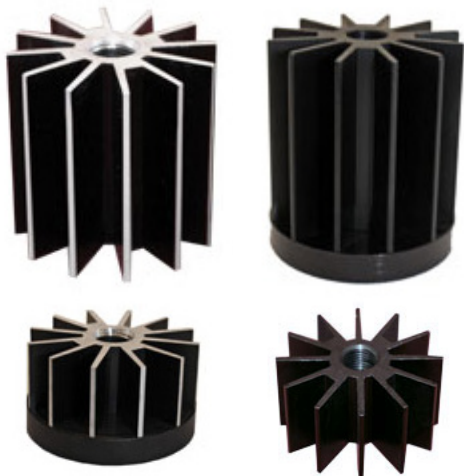
60 mm Diameter & 100 mm Diameter Heat Sinks