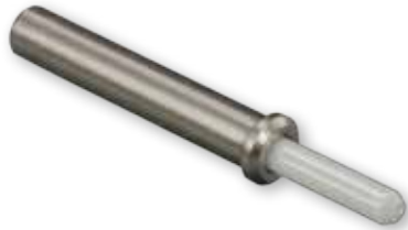
181-057 Pin Terminus

Size 16 fiber optic termini are compatible with all Series 80 Mighty Mouse threaded coupling connectors with size 16 cavities. These snap-in, rear-release termini feature precision ceramic ferrules and sleeves for accurate fiber alignment. Typical insertion loss 0.5 dB. Fits 50/125 and 62.5/125 multi mode and 9/125 single mode fiber.