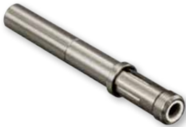
181-075 Socket Terminus