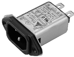
EG3U (With Compact Size)