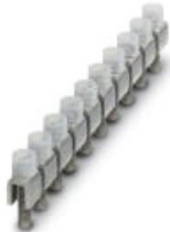
Fixed bridge, Number of positions: 10, Color: silver

Please be informed that the data shown in this PDF Document is generated from our Online Catalog. Please find the complete data in the user's documentation. Our General Terms of Use for Downloads are valid ( http://download.phoenixcontact.com )