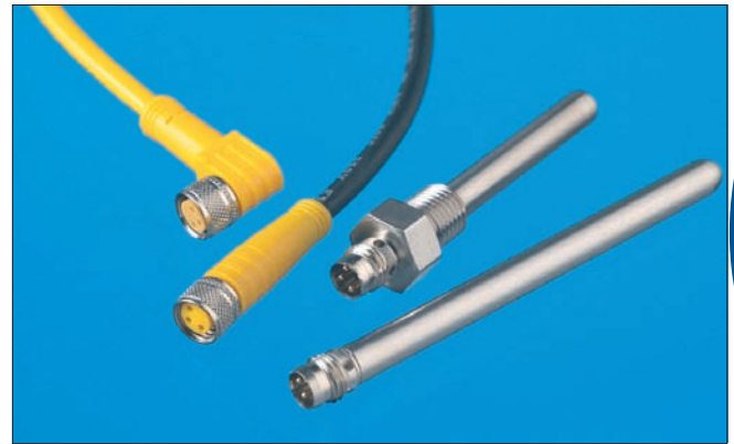
Industrial Grade Temperature Sensors

SS&C types TS and TX are ruggedized probes that seal the sensing element from the outside environment. Because they include industry standard cordsets and connectors they are extremely easy to use. The sealed end design adds an extra level of moisture resistance over previous designs. These products simplify the installation and connection of temperature sensors in the harshest applications where the protection of the sensing element from the environment is critical. With this new design, it is now possible to have a fully enclosed sensor that will provide a lifetime of accurate and reliable sensing. Please contact the factory for specific design or application information or the availability of options.