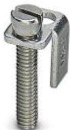
Switching jumper, Number of positions: 2, Color: silver

Please be informed that the data shown in this PDF Document is generated from our Online Catalog. Please find the complete data in the user's documentation. Our General Terms of Use for Downloads are valid ( http://phoenixcontact.com/download )