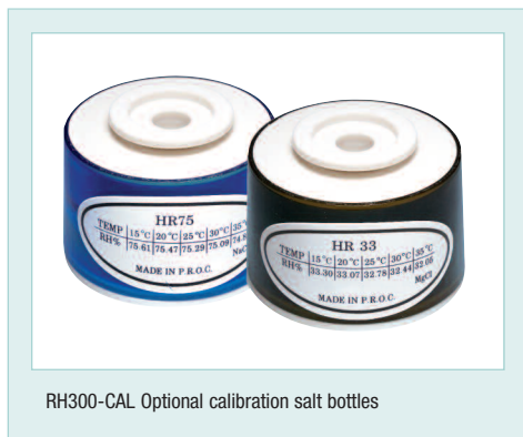
RH300-CAL Optional calibration salt bottles