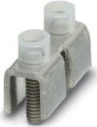
Fixed bridge, Number of positions: 2, Color: silver

Please be informed that the data shown in this PDF Document is generated from our Online Catalog. Please find the complete data in the user's documentation. Our General Terms of Use for Downloads are valid ( http://download.phoenixcontact.com )