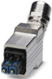
Push-pull connector (version 14), die-cast zinc, with SC-RJ insert for POF, for cable diameter of 5.5 mm ... 10 mm, cable outlet at the bottom

Please be informed that the data shown in this PDF Document is generated from our Online Catalog. Please find the complete data in the user's documentation. Our General Terms of Use for Downloads are valid ( http://phoenixcontact.com/download )