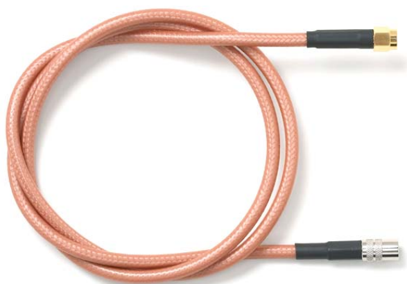
Model 73082 SMA Quick-Connect Plug to SMA Plug, RG142B/U

Small size, and durability for confident connections