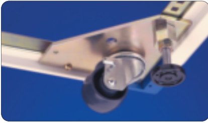
Caster installed with jacking foot