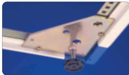
Universal corner bracket with jacking foot standard with frame type 'A' & 'B'

Each Caster Kit includes four (4) locking casters and hardware.