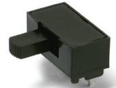
L10201ML04Q Horizontal Actuation SPDT

For mounting information, see TERMINATIONS section, page I-23.