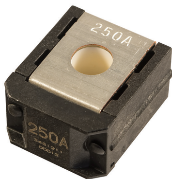
ZCASE Single Mega/Starter Fuse