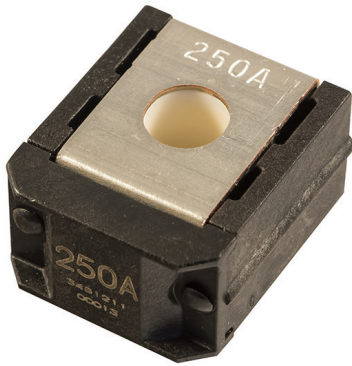
ZCASE Single Mega/Starter Fuse