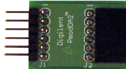
Figure 1 Digilent PmodDA2

The PmodDA2 is designed to work with either Digilent programmable logic system boards or embedded control system boards. Most Digilent system boards, such as the Nexys, Basys, or Cerebot, have 6-pin