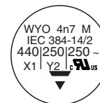
WYO 3.3 nF to 12 nF

All approval marks are also shown on the label.