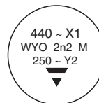
WYO 1 nF to 2.5 nF