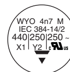
WYO 3.3 nF to 12 nF

All approval marks are also shown on the label.