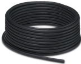
Master cable ring, Application: Distributor boxes, Number of positions: 11, Cable length: 50 m

Please be informed that the data shown in this PDF Document is generated from our Online Catalog. Please find the complete data in the user's documentation. Our General Terms of Use for Downloads are valid ( http://phoenixcontact.com/download )