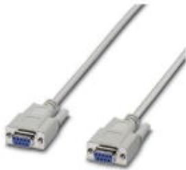
RS-232 cable, 9-pos. D-SUB female connector on 9-pos. D-SUB female connector, 9-wire, 1:1

Please be informed that the data shown in this PDF Document is generated from our Online Catalog. Please find the complete data in the user's documentation. Our General Terms of Use for Downloads are valid ( http://download.phoenixcontact.com )