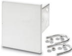
Flat panel antenna, 5 GHz, gain 18 dBi, connection N (female), IP55

Please be informed that the data shown in this PDF Document is generated from our Online Catalog. Please find the complete data in the user's documentation. Our General Terms of Use for Downloads are valid ( http://download.phoenixcontact.com )