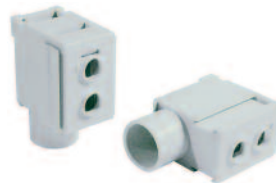
Type/Cat. No: P50UB Description: Modular Direct Power Feed