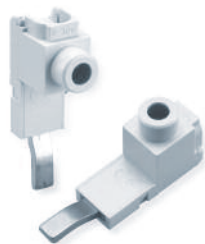
Type/Cat. No: P50UT Description: Power Feed Lug