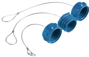
PX0990, PX0991, PX0992