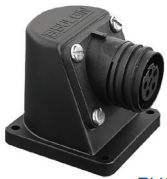
PX0950 & PX0941