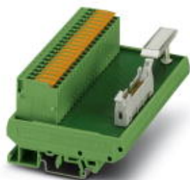
VARIOFACE termination board with knife disconnection and 20-pos. flat cable connector, module width: 111 mm

Please be informed that the data shown in this PDF Document is generated from our Online Catalog. Please find the complete data in the user's documentation. Our General Terms of Use for Downloads are valid ( http://phoenixcontact.com/download )