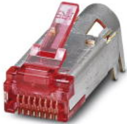
RJ45 male insert, CAT6, 8-pos., shielded, IDC pierce connection, for AWG 27 litz wires ... 24, with strain relief

Please be informed that the data shown in this PDF Document is generated from our Online Catalog. Please find the complete data in the user's documentation. Our General Terms of Use for Downloads are valid ( http://download.phoenixcontact.com )