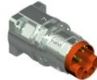
Contact Arrangement mating view

H 53 C 208 NN 00 00 0200 000 H E C 208 N 00 00 0200 000