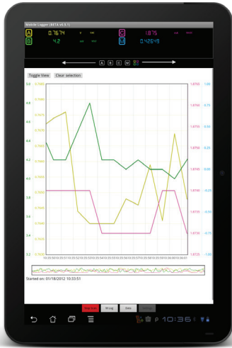
Figure 4. Data logging with Keysight Mobile Logger software.

Data logging is an important function for industrial users to capture data streams or plotting trending graphs. These data and graphs are used for analysis to identify intermittent behavior or detect drifts. Keysight Mobile Logger is the free Android application software that logs data and provides trending graphs from Keysight handheld digital multimeters. Keysight Mobile Logger offers an array of extended functions such as sending e-mail or Short Message Service (SMS) automatically, and pan and zoom function via the Android device's touch screen. Alternatively, data logging and monitoring activities can also be performed at the comfort of one's Personal Computer (PC) via a downloadable Keysight GUI data logger software.