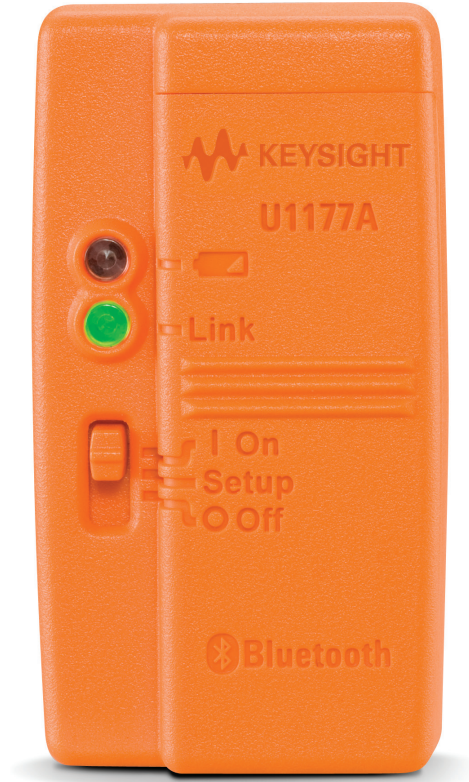
Figure 3. The U1177A as illustrated