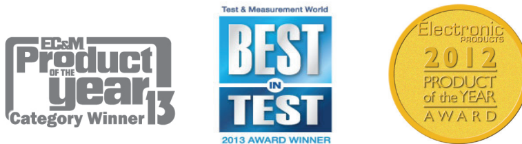
Figure 1. Award winning U1177A Infrared (IR)-to- Bluetooth adapter is being recognized as an innovative solution in Test & Measurement industry

Keysight Technologies, Inc. U1177A Infrared (IR)-to- Bluetooth adapter offers wireless remote connectivity solution via Bluetooth connection simply by attaching the adapter to the IR port of a Keysight handheld digital multimeter. The wireless remote connectivity is set up when a Keysight handheld digital multimeter is connected to U1177A and an Android device (tablet or smart phone) with the installed software. Every U1177A also has a unique Media Access Control (MAC) address. User can quickly and easily scan for the right U1177A using their Android device and pair up with the U1177A.