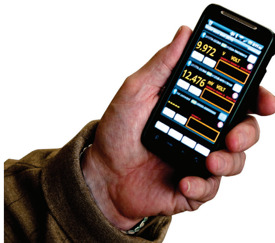
Figure 6. Make measurements with the Keysight Mobile Meter via an Android smart phone

Keysight Mobile Meter is a free Android application software that allows an Android device to connect, control and perform up to 3 multimeter measurements. Without the need to be physically present at various points, users can now extend their reach to two or three places. This solution allows you to make measurements from a safe distance, eliminates the need to walk back-and-forth between measure target and control points, and monitors multiple measurements simultaneously. Achieve higher work productivity when you use the U1177A with your Keysight handheld digital multimeters.