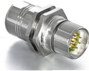
Contact Arrangement mating view

A KU A 020 NN 00 41 0240 000 A K A 020 N 00 41 0240 000