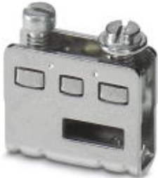
Branch terminal, Connection method Screw connection, Cross section: 0.5 mm 2 - 16 mm 2 , Width: 7.7 mm, Color: gray

Please be informed that the data shown in this PDF Document is generated from our Online Catalog. Please find the complete data in the user's documentation. Our General Terms of Use for Downloads are valid ( http://download.phoenixcontact.com )