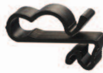
SunRunner 2-U UVX