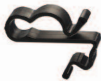
SunRunner 2-R UVX