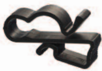
SunRunner 2 UVX