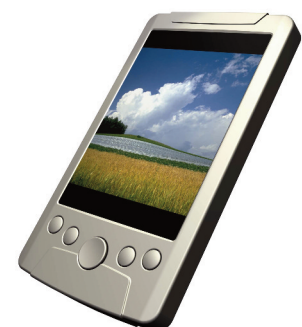
Compact consumer applications