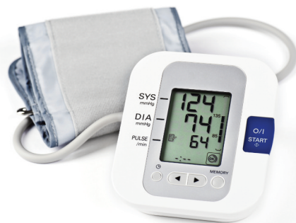
Compact medical applications