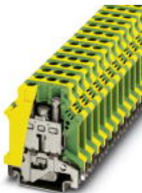
Ground modular terminal block, Connection method: Screw connection, Cross section: 0.5 mm 2 - 16 mm 2 , AWG 20 - 6, Width: 10.2 mm, Color: green-yellow, Mounting type: NS 35/7.5, NS 35/15, NS 32

Please be informed that the data shown in this PDF Document is generated from our Online Catalog. Please find the complete data in the user's documentation. Our General Terms of Use for Downloads are valid ( http://download.phoenixcontact.com )