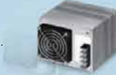
Standard Power Supply with Fan

Fan replacement every 2 to 3 years Dust drawn in by fan