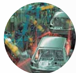
Vehicle manufacturing equipment