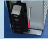
Screw Mounting from Top

Compact right-angle mounting bracket enclosed for easy mounting.