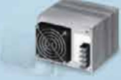
Standard Power Supply with Fan

Fan replacement every 2 to 3 years Dust drawn in by fan