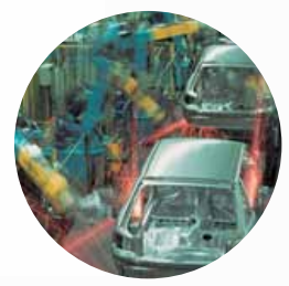
Vehicle manufacturing equipment