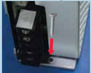
Screw Mounting from Top

Compact right-angle mounting bracket enclosed for easy mounting.