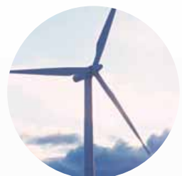
Wind power generation