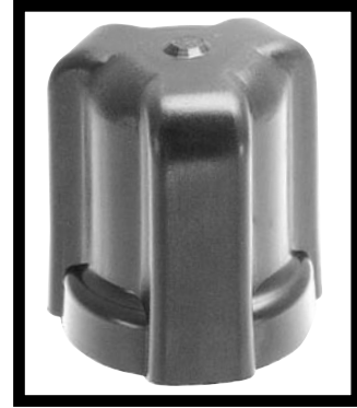
Switch Boot P/N 79380 for Vacuum and Pressure

Type: Direct action blade contact Contacts: Silver alloy, gold plated Set Point: Factory set from 0.5 to 150 PSI Operating Pressure: 150 PSI for 0.5-24 PSI set point range, 250 PSI for 25-150 PSI set point range Proof Pressure: 500 PSI Burst Pressure: 750 PSI for 0.5-24 PSI set point range, 1250 PSI for 25-150 PSI set point range.