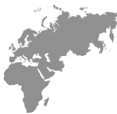
Europe Middle East Africa