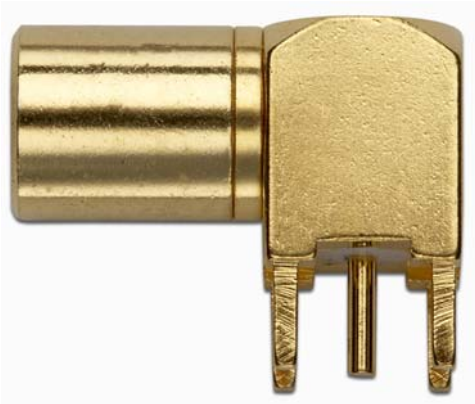
Model 72997 SMB PLUG R/A PCB RECEPTACLE