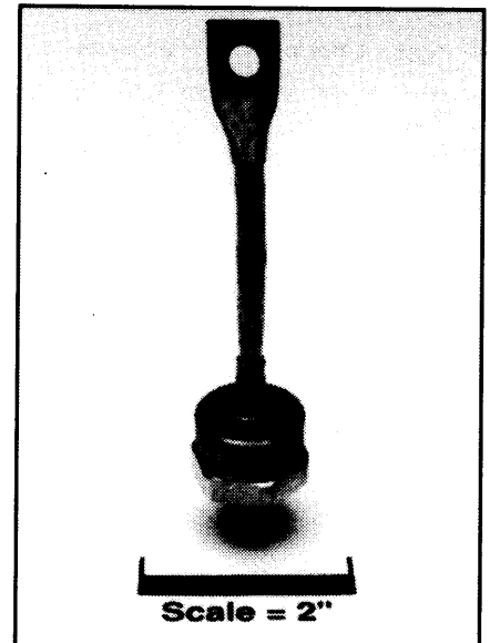
IN3288A, AR - IN3297A, AR (Outline Drawing)