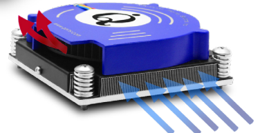
dualFLOW™ airflow direction