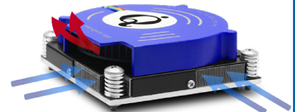
quadFLOW™ airflow direction