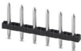
The figure shows a 6-position version

Pin strip, nominal current: 12 A, number of positions: 4, pitch: 5 mm, color: black, contact surface: Tin, The maximum current depends on the plug used. The lower of the two current values apply for plug and pin strip. The pin strip is made of highly temperature resistant plastic and is thus suitable for the reflow process.