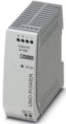
Primary-switched UNO power supply for DIN rail mounting, input: single-phase, output: 5 V DC/40 W

Please be informed that the data shown in this PDF Document is generated from our Online Catalog. Please find the complete data in the user's documentation. Our General Terms of Use for Downloads are valid ( http://phoenixcontact.com/download )