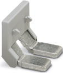
Insertion bridge, Number of positions: 2, Color: gray

Please be informed that the data shown in this PDF Document is generated from our Online Catalog. Please find the complete data in the user's documentation. Our General Terms of Use for Downloads are valid ( http://download.phoenixcontact.com )